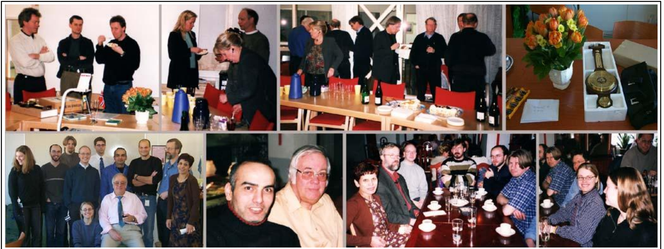
Det var en ekstra mottagelse i bedriftens k nderom for venner fra «Store» Ericsson og andre som hadde sluttet hos oss. Den ble ogs  en trivelig kveld med de n rmest s rgende.

Jeg gikk i pensjon v ren 2002. Tidspunktet var vel valgt, v re arbeidsoppgaver skulle overf res til Shanghai, og alle i gruppen flytte til «Store Ericsson» for nye arbeidsoppgaver.