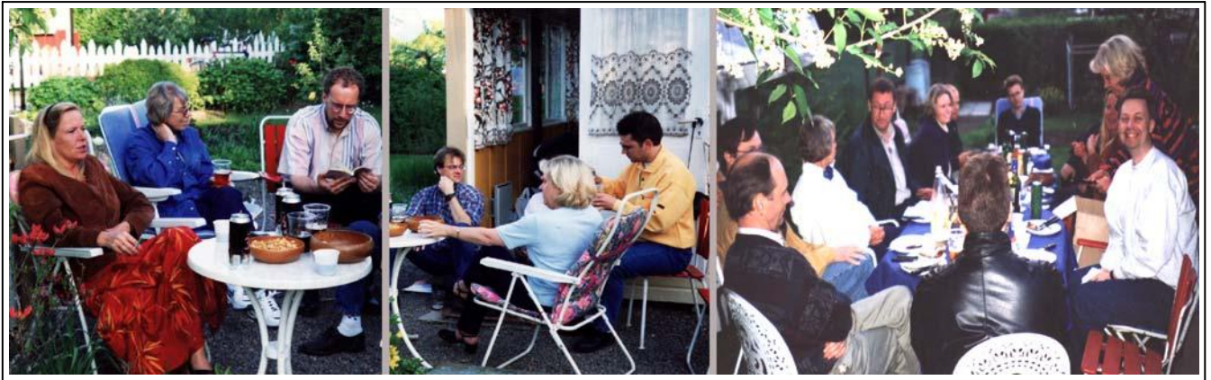
Samlet på vår koloni for å minnes TeamWARE som nå hadde «gått i graven».

Ved juletid i 1997 ble våre naboer i huset - som var ansatt ved «Fujitsu ICL Personal Computers» - oppsagt. De ble innkalt til et møte hvor de antok at de skulle få utvidede arbeidsoppgaver, men den gang ei! Etter en tid ble de fleste ansatt på «Ericsson Radio Systems AB» i en ny divisjon med navnet «Ericsson Center for Wireless Internet Integration».