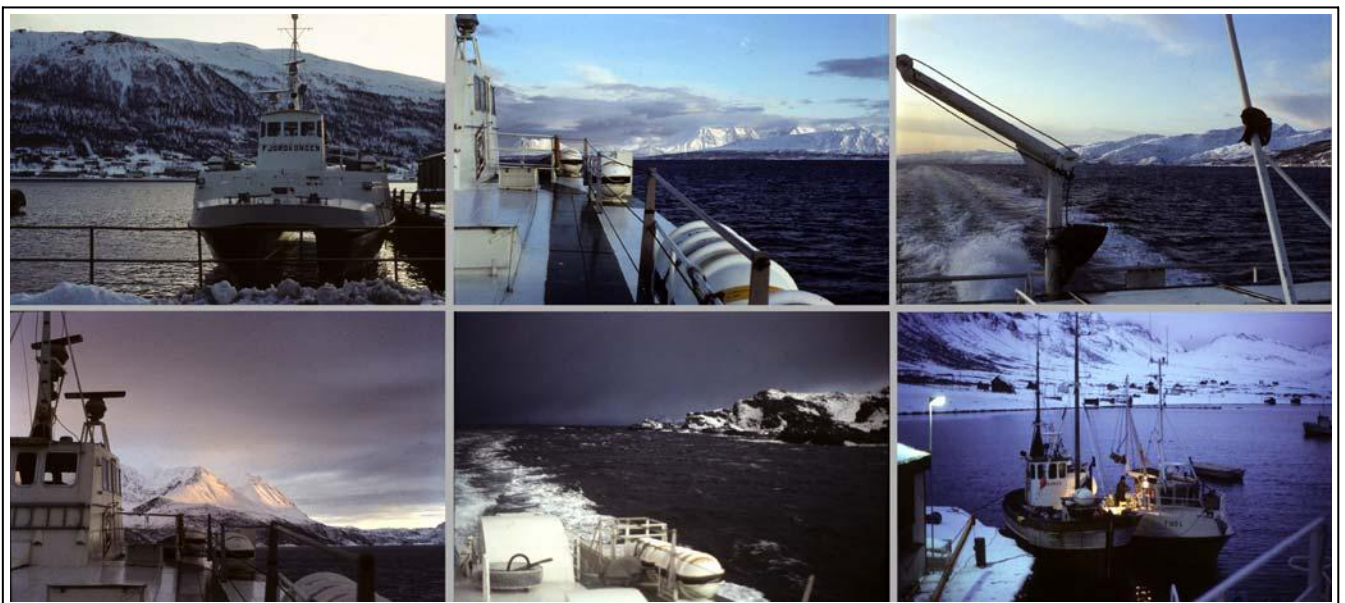
Med «Fjordkongen» opp til Skjervøy og tilbake. Reisen gikk opp langs Lyngsalpene og fra Skjervøy var det utsikt mot Lophavet i nord.

I praksis førte dette snart til at jeg hadde tre store arbeidsoppgaver samtidig, utvikling av konfigureringsprogrammene, drift av labbet og støtte i samarbeidet, først med finske, og senere med norske sparebanker!