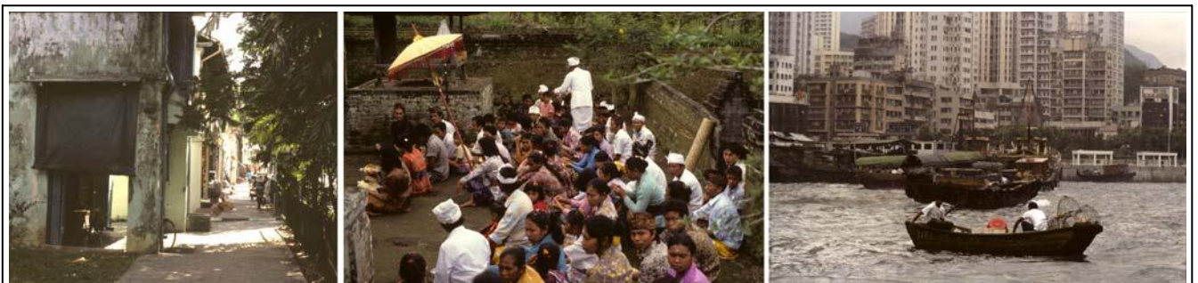
Gatebilde i Singapore - Gudstjeneste på Bali - Aberdeen i Hongkong.

Oppholdet i Melbourne varte i 2 måneder og frem mot påske kom også min gode venn Antti Kytömäki ned for å hjelpe til, hvilket var meget viktig da han nøt stor tillit i banken. Alt sluttet bra, «våpnene» ble lagt ned, og vi avsluttet oppholdet med en meget hyggelig lunch på en utendørsrestaurant, invitert av styreformannen til Bull i Sydney!