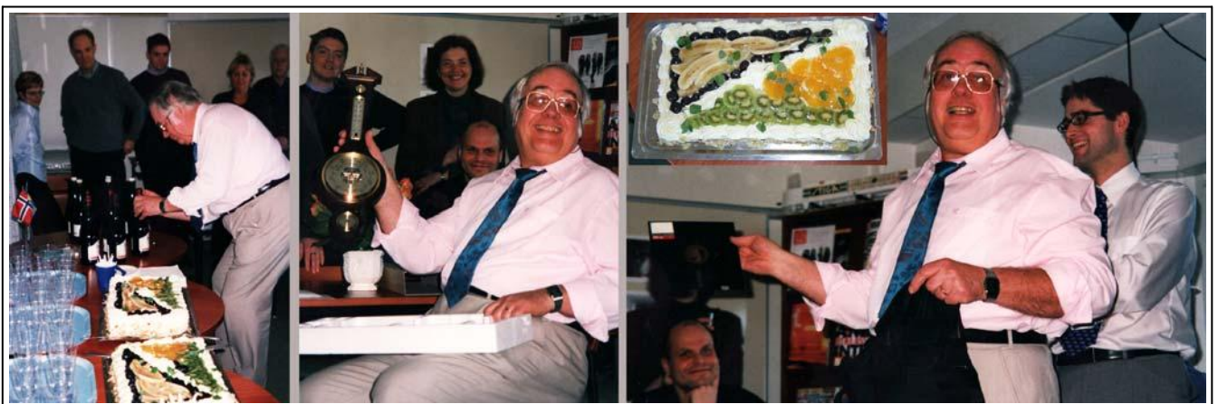
Jeg inviterte til fest når jeg gikk i pensjon. Til min store glede var det stort fremmøte og jeg fikk minnerike presentar fra Ericsson og kollegaer, bl. a. et barometer, en 8" diskette(!) og et solur til kolonien.

I begynnelsen av året 2000 var det «dags» igjen. Endel måtte slutte, andre ble flyttet over til det vi kalte «Store Ericsson», det nye store hvite kontorhus som var vår nærmeste nabo. Deler av den huskroppen vi tilhørte, ble tømt og leid ut til andre bedrifter. Selv inngikk jeg nå i «PSEM - Personal Service Environment Management», en del av «Ericsson Internet Applications». Avdelingen tok frem en «Subscription Manager». Det ble nye utfordringer med programmering i Java, JavaScript og HTML-miljø. Jeg tok selv først frem en applikasjon som ble kalt «CAI - Customer Administration». Det siste jeg arbeidet med før jeg gikk i pensjon var å utvikle dynamiske skript ved hjelp av XML og stylesheets.