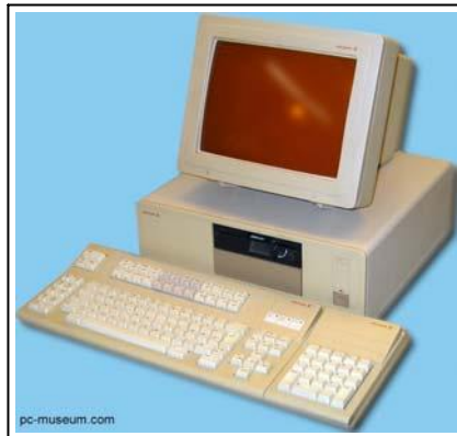
Ericsson Information Systems første PC fra 1984.

I en sparebank på Toten mente de ansatte at det tok for lang tid å starte opp systemet. Tidligere maskingenerasjoner hadde hatt programmene lagret i interminnet, slik at de ble aktive med en gang maskinen ble slått på. Nå måtte maskinene først lades i tur og orden fra filer på lagringsenhetene, og dette tok noe tid. Jeg ba gode venner i Linköping ta frem en «patch» som ga fra seg et «pip» når alt var klart. Det løste problemet, alle visste nå når deres maskin var klar, og «patchen» ble lagt inn som standard i systemet.