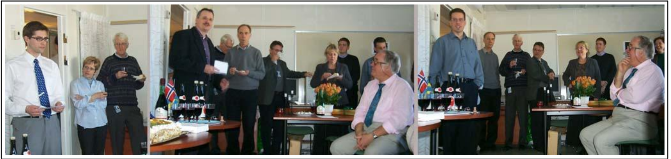
Mine sjefer holder taler for pensjonæren.